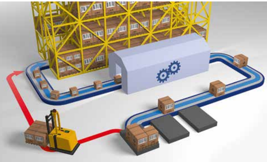
Dynamische Transportwegwahl und 100-prozentige Rückverfolgbarkeit